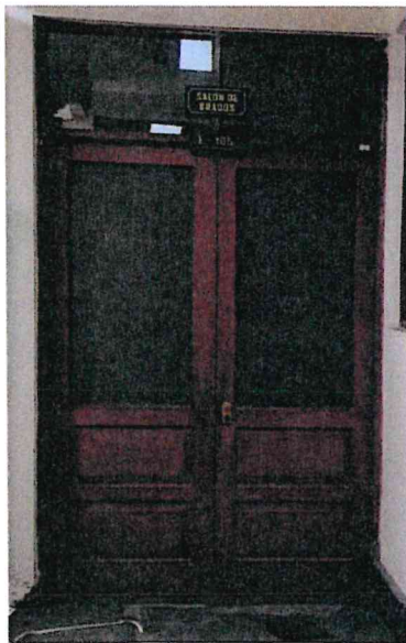
P-03 ( 2 UND)