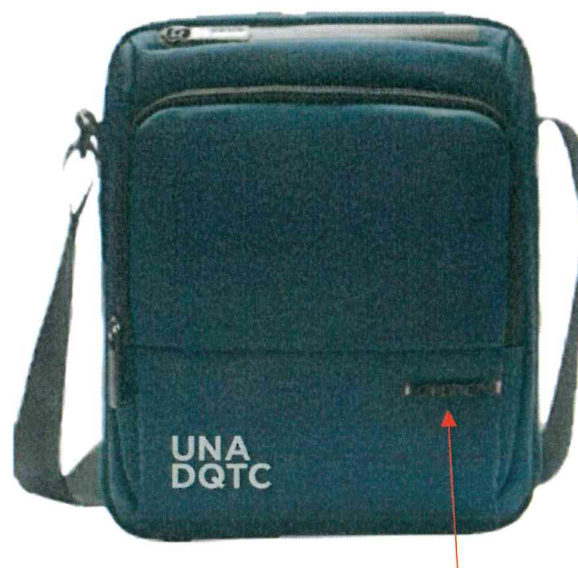
Distintivo de Metal