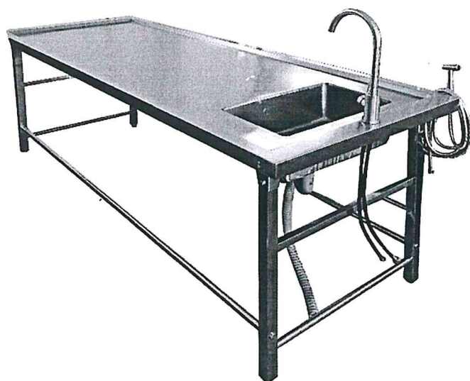
GRÁFICO DEL EQUIPO Y MOBILIARIO